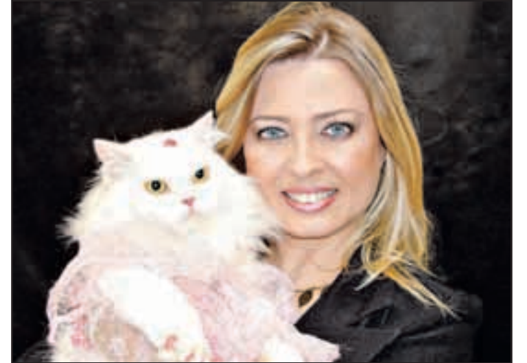
Cecy e a gata-propaganda Nikole: cama de solteiro só para a felina